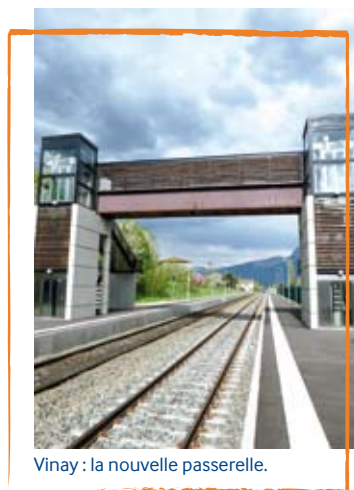
Vinay : la nouvelle passerelle.

Offrir une accessibilité maximale au plus grand nombre, c'est trouver des solutions pour traverser les voies (installation de passerelles, de passages souterrains équipés d'ascenseurs et de rampes d'accès), pour sécuriser les déplacements sur les quais (pose de bandes d'éveil en bordure de quais, revêtement de sol), pour monter à bord des trains et en descendre facilement (rehaussement des quais pour les mettre à une hauteur équivalente au plancher des trains, allongement des quais pour l'accueil de trains plus longs offrant davantage de places...).