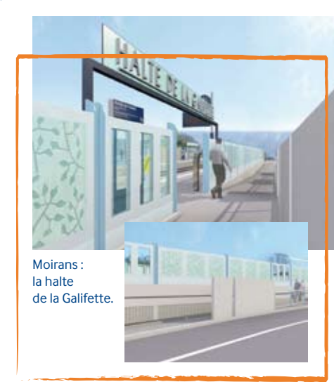
Moirans : la halte de la Galifette.