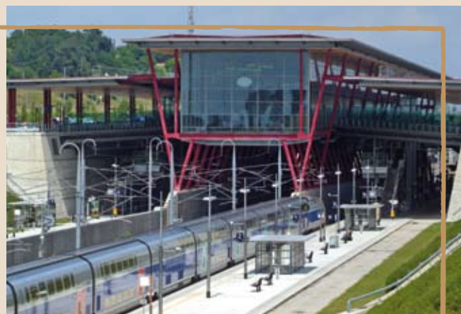
Gare Valence TGV.

Prochaines étapes : la remise du rapport de la commission d'enquête au préfet dans les six mois, puis la parution d'un arrêté interpréfectoral (Savoie, Isère et Drôme) qui seront tous deux rendus publics et consultables auprès de l'ensemble des maires concernés.