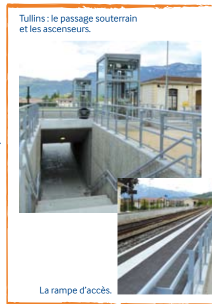
Tullins : le passage souterrain et les ascenseurs.