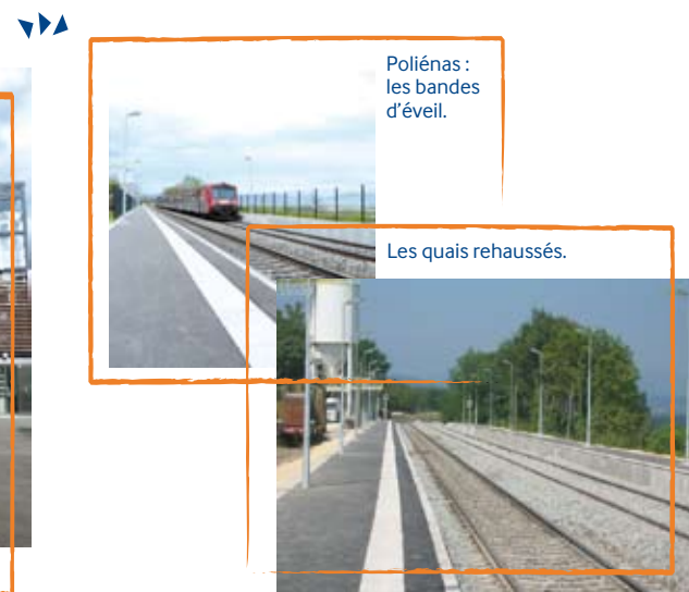
Poliénas : les bandes d'éveil.