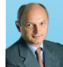
M. Didier MIGAUD Président de La Métro

La Métro poursuit ce travail partenarial pour la deuxième phase qui concernera la section Gières-Montmélian, qui permettra d'accroître le nombre de dessertes TER des gares d'Échirolles, de Gières, du Grésivaudan et de créer de nouvelles haltes dans le sud et l'est de l'agglomération grenobloise.